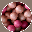
34545 Sublime Radiance

Постои вистинска нијанса на топчиња за нијансирање како создадена за тебе. Во палетата на Giordani Gold сигурно ќе ја пронајдеш!