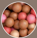
34546 Luminous Peach