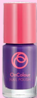
41734 Plum Daze