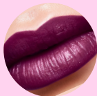
38779 Purple Berry