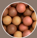
34548 Matte Bronze

Sublime Radiance: нашата класична нијанса сега е пожива за посилен ефект.