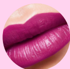
38775 Clover Lilac