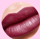
38777 Grape Purple