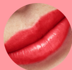
41731 Mad Red