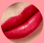
41732 Frantic Cherry