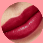
41733 Fire Maroon