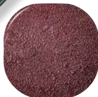
40743 Burgundy Gold