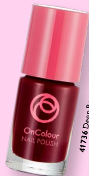
41736 Deep Berry