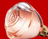
42514 Volare Намалена цена : 449 ден