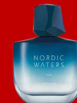
38550 Nordic Waters Намалена цена : 559 ден

Додадете го избраниот производ во нарачката со која го исполнувате условот, поточно во чекор 2 од нарачката. Промоцијата важи само за првата нарачка што ќе ја направите во тековниот каталог, а условот мора да се исполни со една нарачка. Важи за сите Бренд Партнери и Бјути купувачи, вклучувајќи ги регрутите од тековниот каталог, понудата може да се користи само еднаш по каталог.