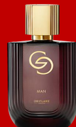
38538 Giordani Gold Man Намалена цена : 559 ден