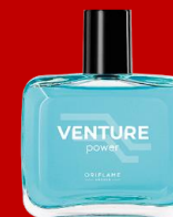
44308 Venture Power Намалена цена 359 ден