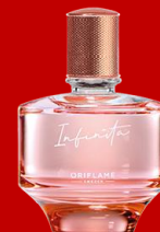
35653 Infinita Намалена цена : 559 ден